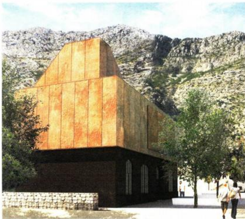
H2O kuća, Komolac, NONA d.o.o. (Davor Bušnja)