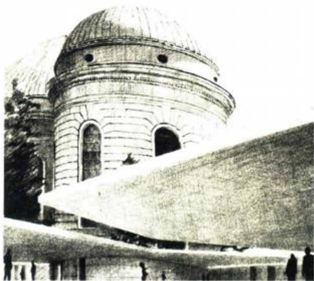
Katedrala sv. Hedvige, MENIS ARQUITECTOS (Fernando Menis, Božo Benić, Katarina Mojaš, Mario Pervić, Luca Spitoni, Zuzana Tomečkova)

angažirano više od stotinu arhitekata, urbanista, dizajnera interijera i drugih stručnjaka, zbog čega sam uvjeren kako će posjetitelji u mnogim projektima primijetiti pravu virtuoznost u artikulaciji i prostora i detalja – napominje Benić, ističući kako arhitekti imaju dužnost na ovakve i slične načine redovito komunicirati s javnošću, promičući arhitekturu kao dio kulture i identiteta. Stoga, s nestrpljenjem iščekujemo 18. travnja, kada će zainteresirana javnost prvi put na jednom mjestu moći vidjeti brojne zanimljive projekte iz zemlje i inozemstva, a na kojima su dubrovački arhitekti radili u proteklih pet godina. • MNJ