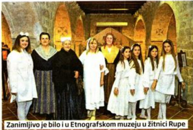
Zanimljivo je bilo i u Etnografskom muzeju u žitnici Rupe