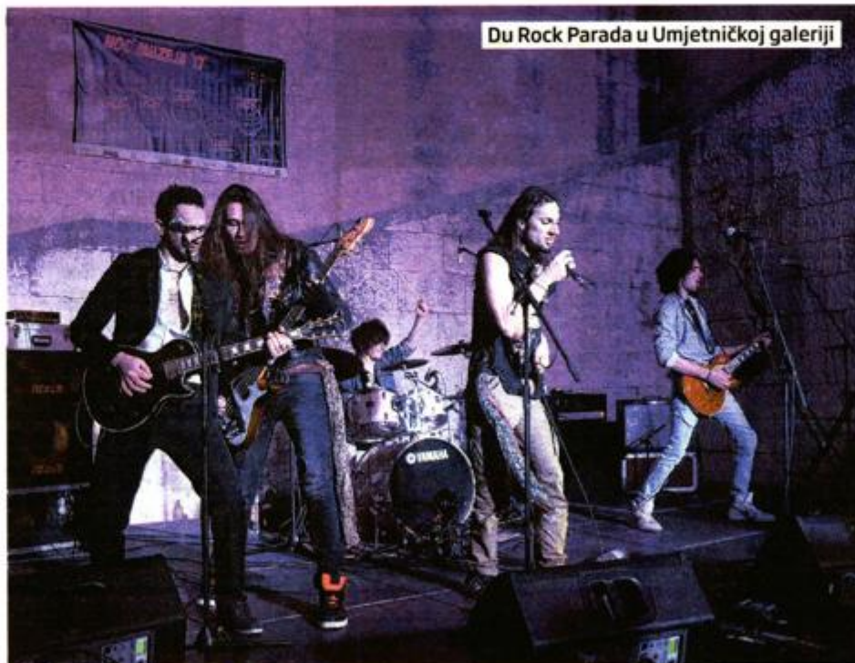
Du Rock Parada u Umjetničkoj galeriji

Pored brojnih radionica za djecu, u Prirodoslovnom muzeju otvorena je izložba „Lepidoptera“ na kojoj su predstavljeni no-