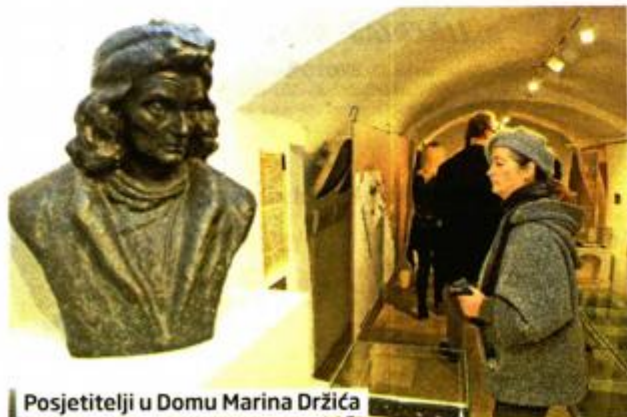
Posjetitelji u Domu Marina Držića

vi primjerci iz Zbirke kucka Prirodoslovnog muzeja Dubrovnik. Autori izložbe su Ana Kuzman i Toni Koren, a posjetitelji su se upoznali s bogatom faunom dnevnih i noćnih leptira dubrovačkog područja. Prikupljanje novih primjeraka započelo je 2015. godine, otkad je na području Dubrovačko-neretvanske županije prikupljeno 400 primjeraka.