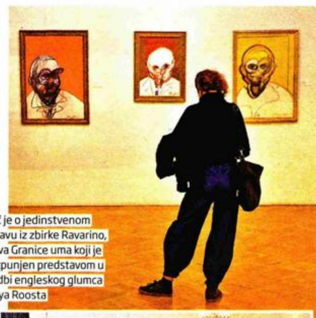
Riječ je o jedinstvenom postavu iz zbirke Ravarino, naziva Granice uma koji je upotpunjen predstavom u izvedbi engleskog glumca Garrya Roosta

Na otvaranju su posjetitelji, osim ove iznimne izložbe, imali priliku pogledati i izvedbu monodrame Pope Head - The Secret Life of Francis Bacon, koju je napisao i izvodi engleski glumac Garry Roost.