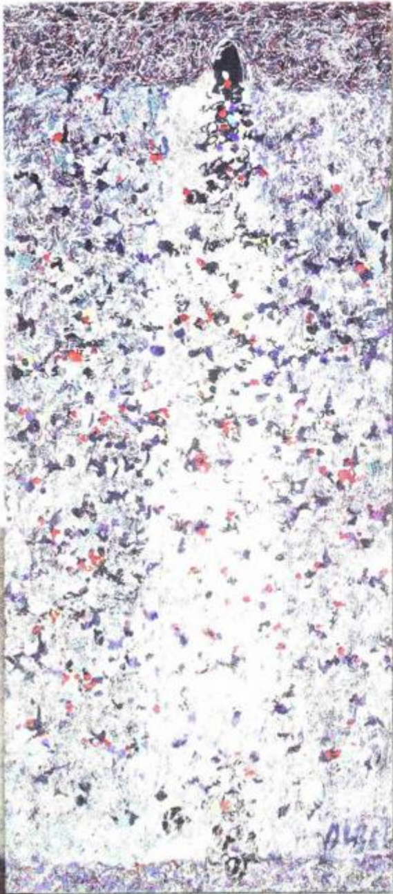
Stradun ljeti, 1964