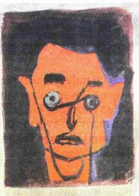
Crveni autoportret, 1960.

ju, slušati ozbiljnu glazbu, vidjeti solidne kazališne predstave, suradivati u improviziranim novinskim inicijativama i - što je najvažnije - mogao je doći do slavnog kritičara Koste Strajnića. Taj je slavni pisac, podsjeća Maroević, tek naizgled zametnut i povučen u Dubrovniku tridesetih godina, okupljao oko sebe mnoge značajne umjetnike (Konjovića, Dobrovića, Postružnika), imao lijepu biblioteku europske umjetnosti te na taj način privlačio mnoge što su se, poput Dulčića, željeli okušati u slikarstvu. A srodstvo s Miličićem omogućilo mu je da doživi susrete s Dobrovićem i u vlastitom