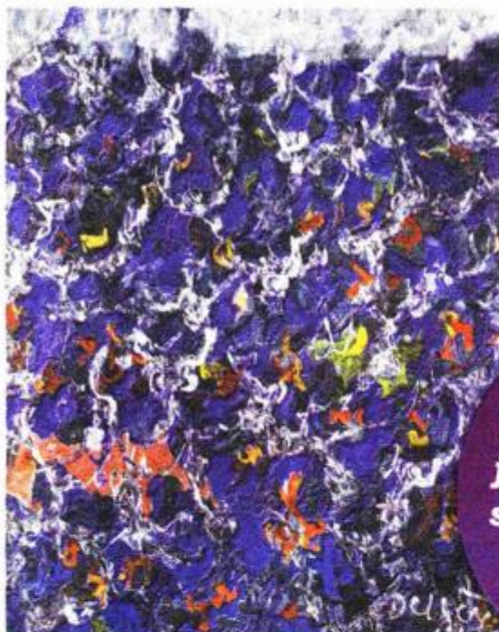
Maestral I, 1954.