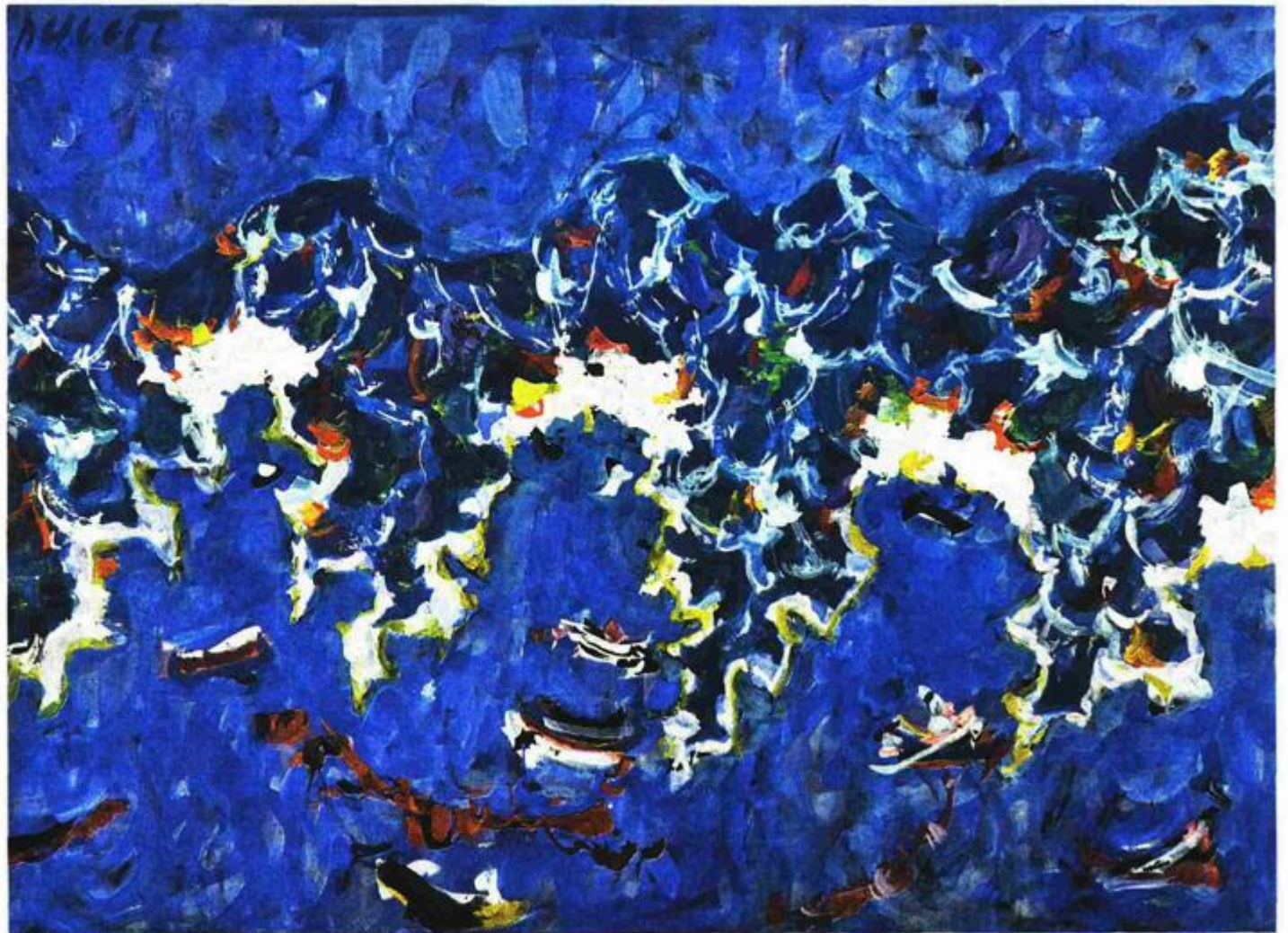
Hvarske vale , 1956.

Tematika je slikarstva Iva Dulčića krajolik, mrtva priroda, interijer, žanr-scene, nadalje čovjek, naizgled uobičajeni slikarski motivi koji majstorstvom slikara, finom kolorističkom gamom, suptilnošću izraza, postaju remek-djela stvarana toplinom i strašću iznimnoga stvaralačkog osjetila slikara iskonskog Mediteranca. Nasuprot figuraciji koju je ustrajno njegovao, pečat svojoj likovnoj osob-