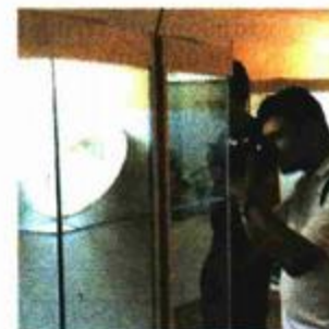
Keramika iz zlatnog doba Dubrovnika