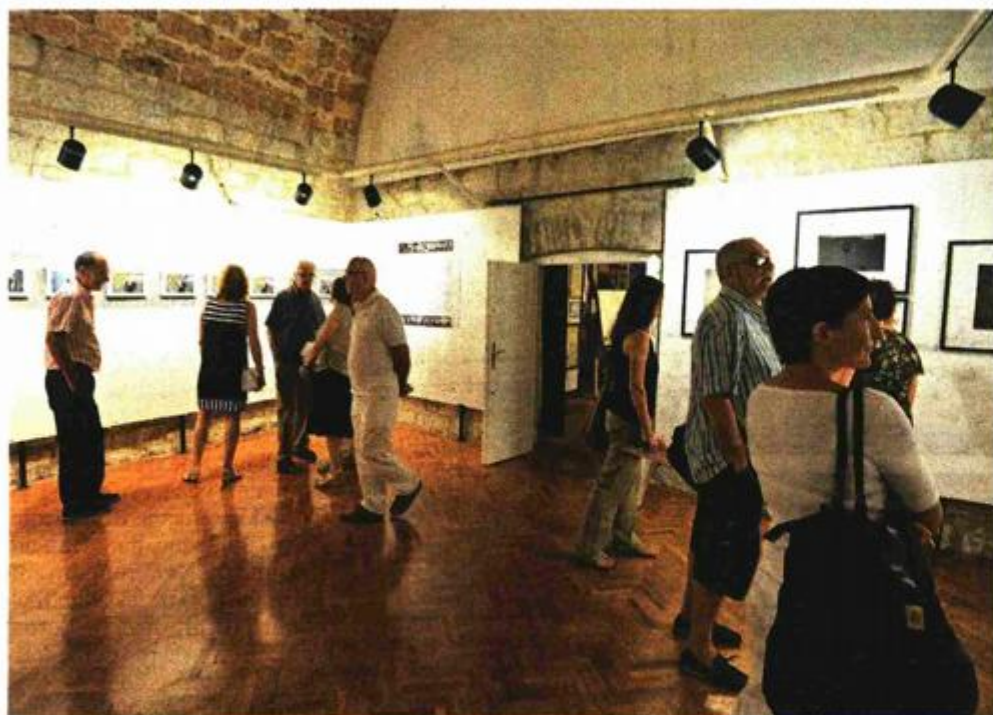
Posavčeve fotografije privukle su Dubrovčane