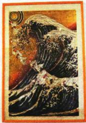
Radionica japanske grafike