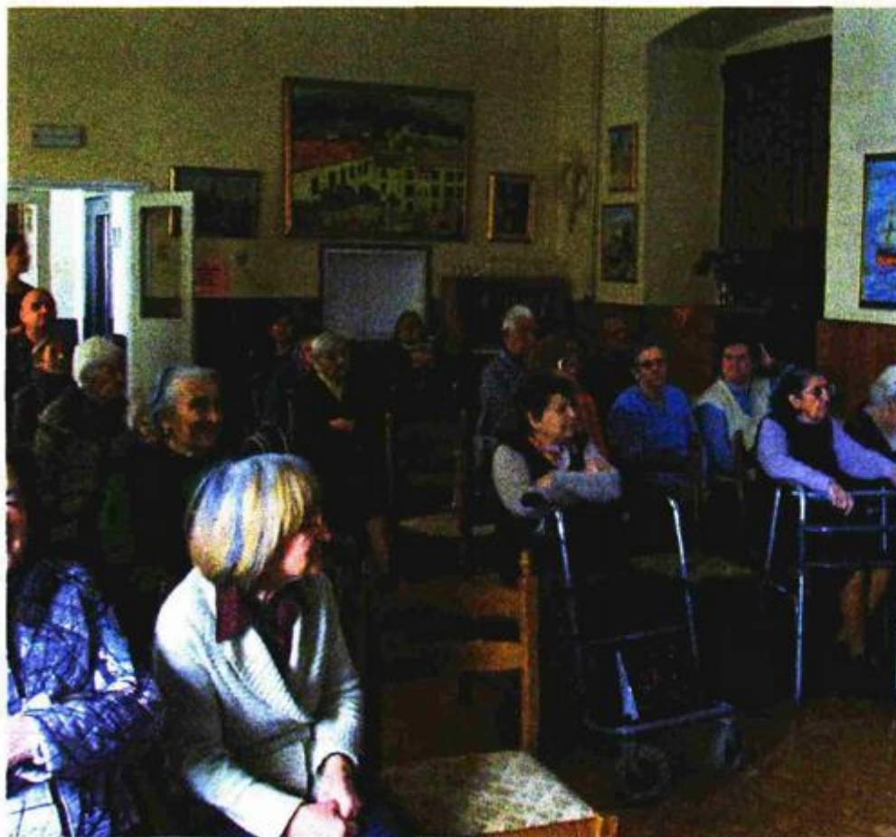
Brojna publika iz Doma za starije i nemoćne osobe 'Domus Christi'

– Kad vas zatvorenik upita je li Aleksa Šantić, bosanskohercegovački pjesnik i jedan od najpoznatijih predstavnika novije lirike u BiH, u rodu s Perom Šantićem, ili kad vam drugi zatvorenik kaže da mu je lakše čitati Dostojevskog nego nacrtati čovjeka, onda vidite da i zatvor u neku ruku može biti i jest mjesto gdje kultura ima