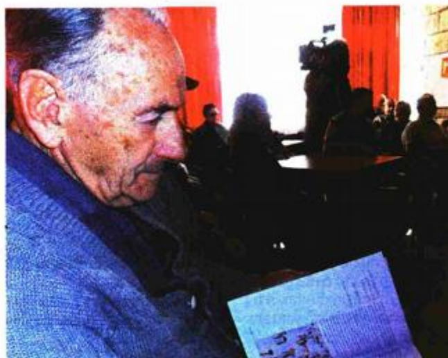
Predstavljanje u Domu za starije i nemoćne osobe 'Dubrovnik'

svoje mjesto te da i zatvorenici znaju uživati u kulturnim sadržajima. Treba inzistirati na komunikaciji koja mora biti dvosmjerna. Kad učinite da ljudi prepoznaju svoje vlastite probleme, dvojbe, kvalitete kroz intelektualni i osjetilni užitek, kad pripomognete da prirodna povezanost između čovjeka i umjetnosti barem na trenutak oživi, zainteresiranost i uzajamno zadovoljstvo ne izostaju – kaže voditeljica projekta.