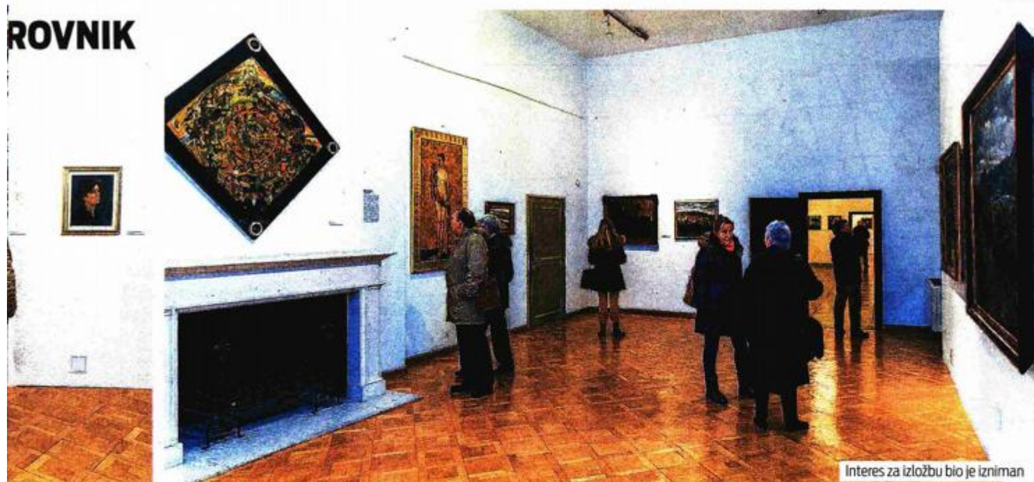
Interes za izložbu bio je izniman

Autorica je od modernizma uzimala onoliko koliko joj je trebalo