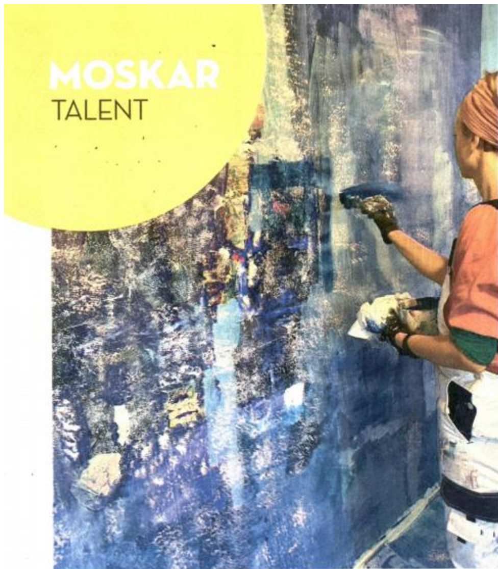
Kolaž je oduvijek bio njezina tehnika

Na izložbi ću se predstaviti s četrdesetak radova, s nekoliko prostornih instalacija, skulptura u staklu i slika na platnu velikih formata koji će biti postavljeni u jedinstvenoj Palači Banac Umjetničke galerije Dubrovnik."